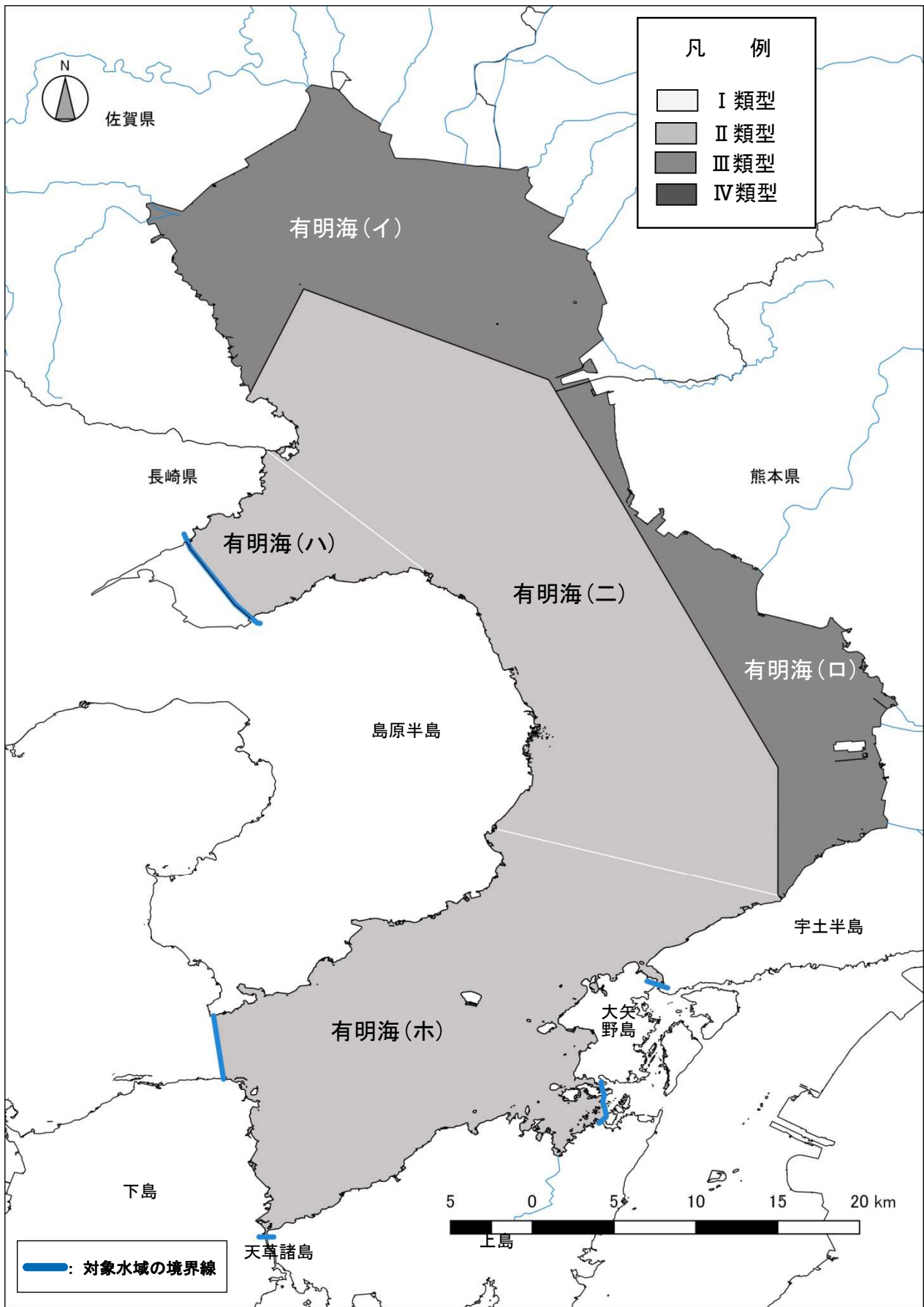
【有明海】全窒素及び全磷に関する海域類型指定概況図