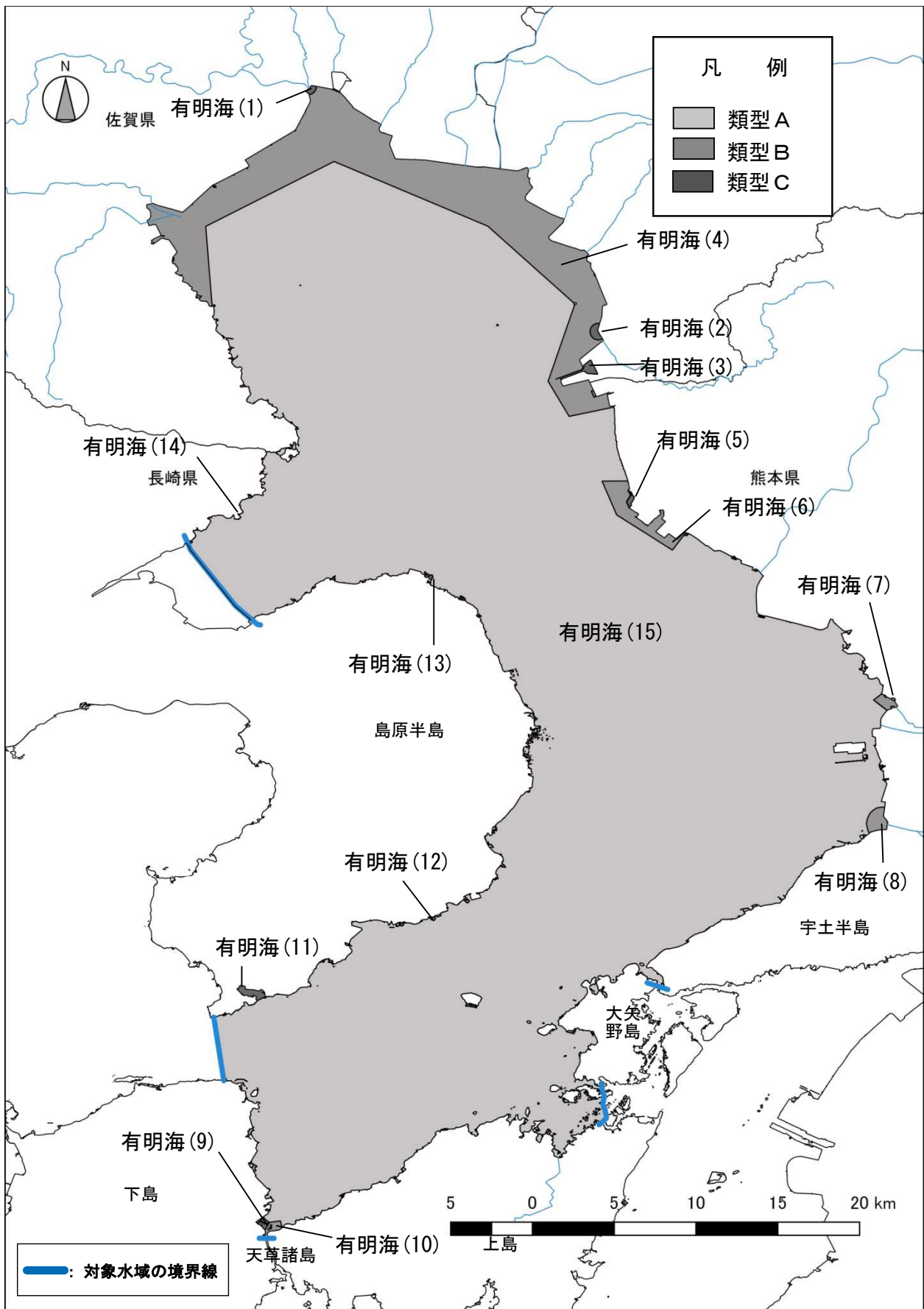
【有明海】COD等に関する海域類型指定概況図