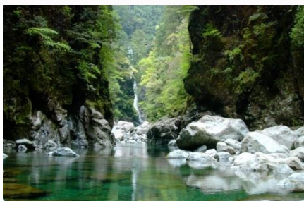
大杉谷峡谷シシ淵