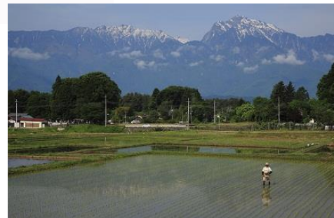
甲斐駒ヶ岳と水田