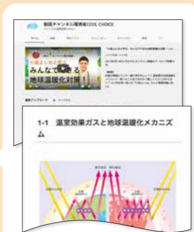
さまざまな環境教材をご紹介します。