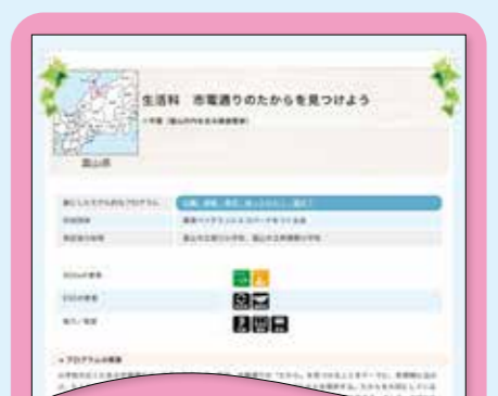
③ ESD モデルプログラム<実践例>