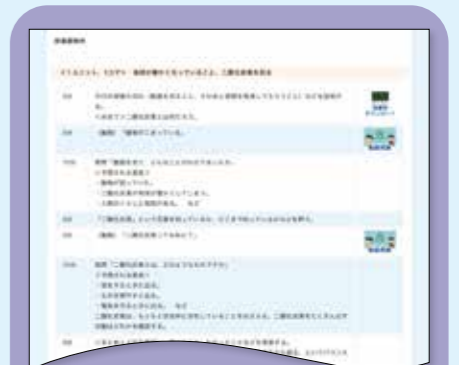
① 脱炭素教材<授業展開例>