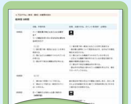
② ESD モデルプログラム<授業展開例>