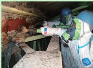
吹付け石綿の除去作業の様子

※ 改正法の施行期日(公布日:令和2年6月5日) ・ 下記以外の規定:公布日から1年以内で政令で定める日 ・ 調査結果の報告:公布日から2年以内で政令で定める日