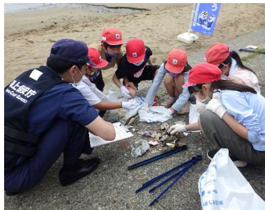
漂着ごみ分類調査