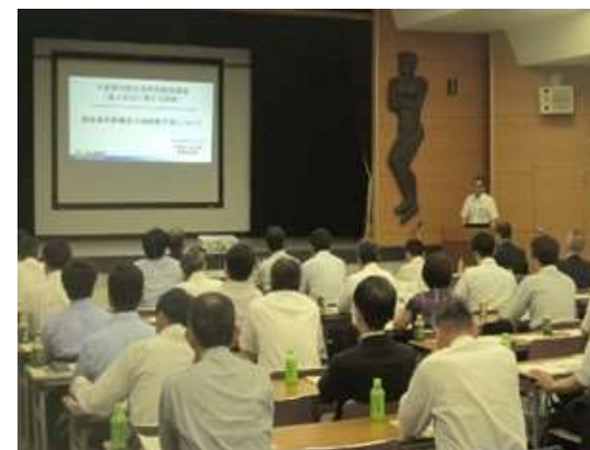
海洋環境保全講習会