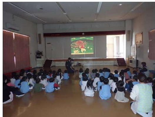
環境紙芝居の上演