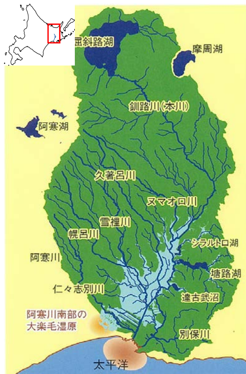
自然再生の対象となる地域