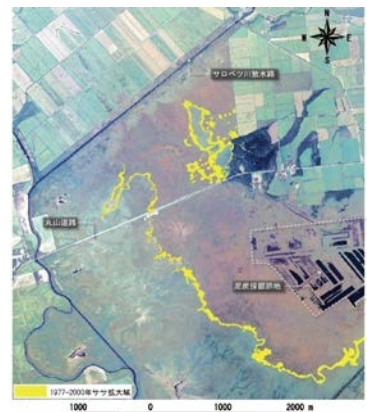
図2 ササ生育地の変化(ササ前線)

多くの絶滅のおそれのある貴重な動植物種が確認され、生物多様性の豊かな空間であることから、現況の維持（これ以上、埋塞が進まない状態）を目標とし、そのための対策を講じる。