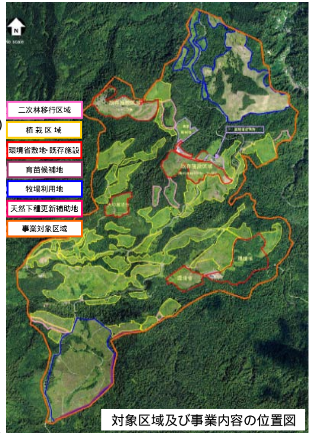
対象区域及び事業内容の位置図

さらに、鳥や風によって運ばれる種子による更新が期待されることから、島や天然下種更新地に土壌改良材等を散布して耕耘し、種子の発芽と生長に必要な土壌の軟度と土量が確保されるように配慮する。