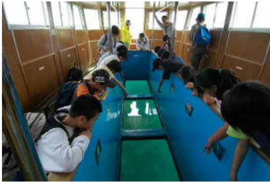
グラスボートによる総合学習