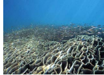
シコロサンゴの大群落