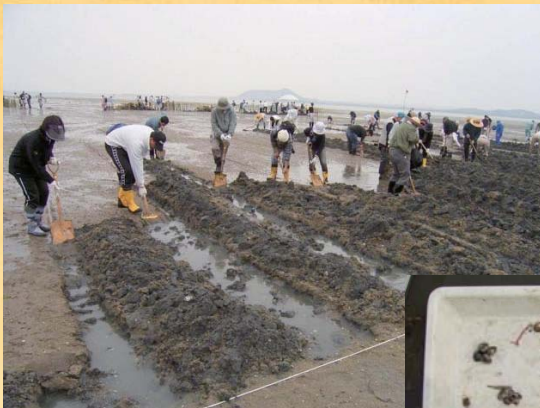
地域住民による干潟耕耘