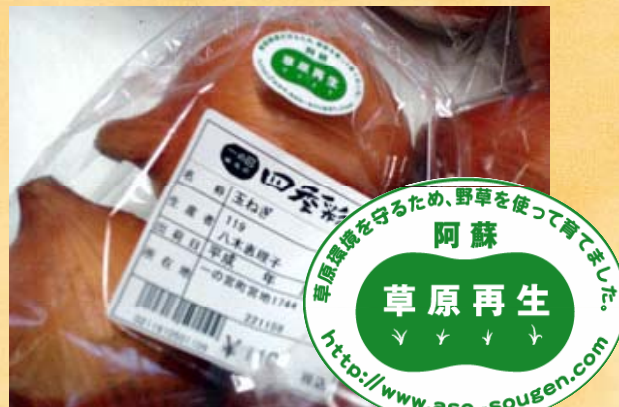
草原再生シールを貼った野菜