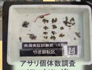
アサリ個体数調査 (モニタリング)