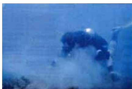
海底に堆積している泥