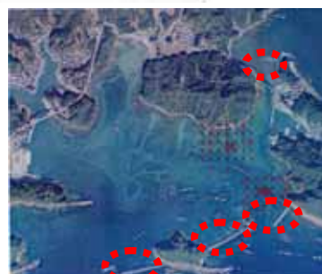
防波堤整備箇所(赤点線部分)