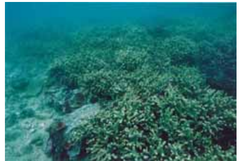
エダミドリイシサンゴ群集