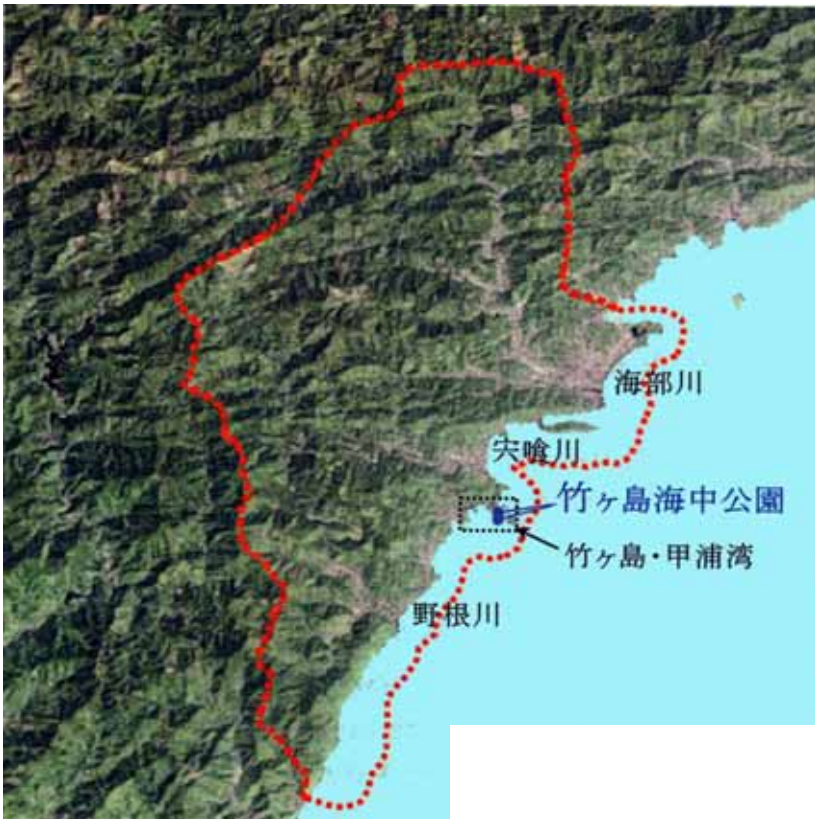
自然再生の対象となる区域(全体構想より)