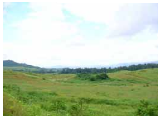
現在では牧場の需要は減少し草原の中に二次林が点在する状況になっている