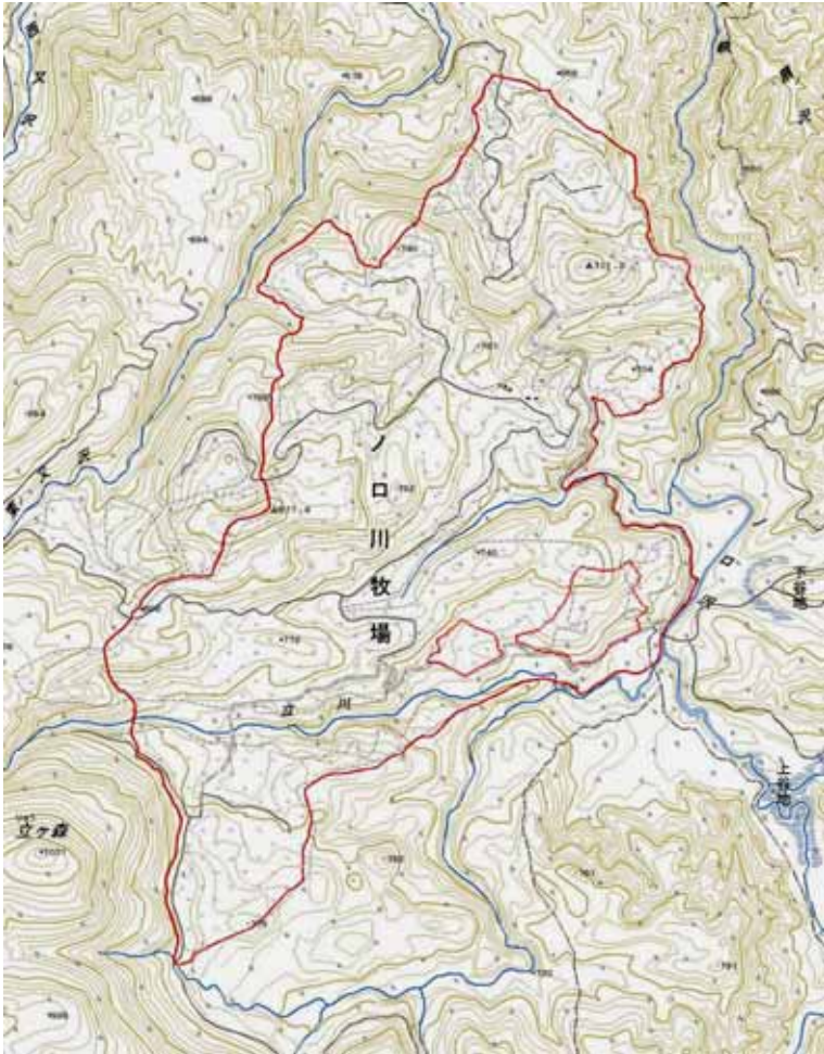
自然再生の対象となる区域(全体構想より)