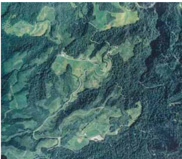
昭和50年頃からおよそ500haもの広大なブナ林が伐採され、牧場造成工事が実施された