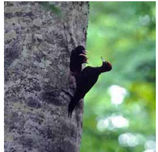
森吉山麓は本州では数少ないクマゲラの繁殖地の一つであるが、生活環境とする森林面積の不足が懸念されている