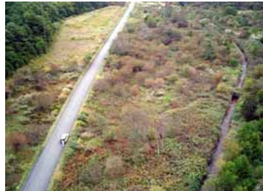
排水施設や道路建設が原因と思われる 湿原の乾燥化が進行している