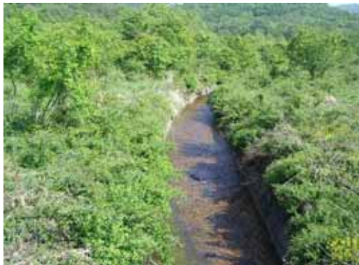
乾燥化の一因の コンクリート三面張水路