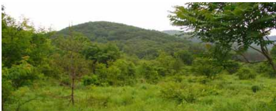
周辺部からアカマツやイヌツゲ等の木本類が侵入し、湿原環境やそれを生育・生息基盤とする動植物の存亡が危ぶまれている