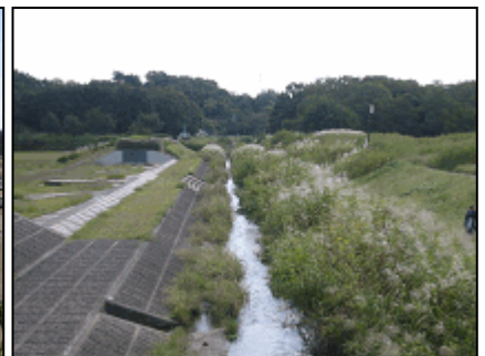
野川（小金井新橋下流）