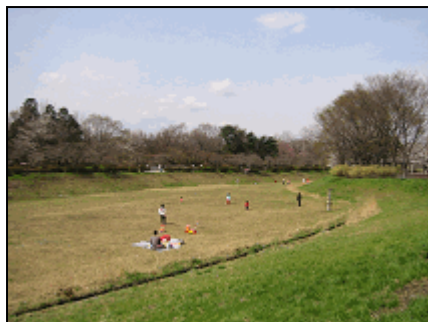
野川第一調節池（東側）