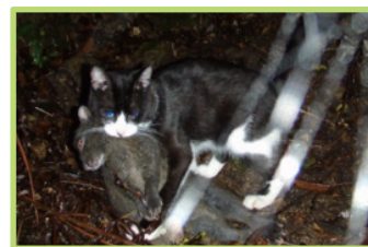
アマミノクロウサギを捕食するノネコ

ノネコは小型哺乳類や鳥類、爬虫類、両生類、昆虫類などさまざまな生き物を食べてしまいます。また、エサとして食べてしまうだけでなく、「遊び」としてのハンティングを行うことも。さらに、1頭のメスが生涯に50～150頭も出産可能なため、野外でどんどん増えて希少種に大きな被害を与えています。ノネコは世界や日本の侵略的外来種ワースト100に選ばれています。