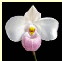
例：ラン科バイオペディルム属