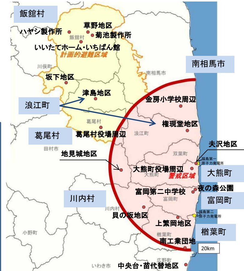
【 除染モデル実証事業対象地区の位置 】