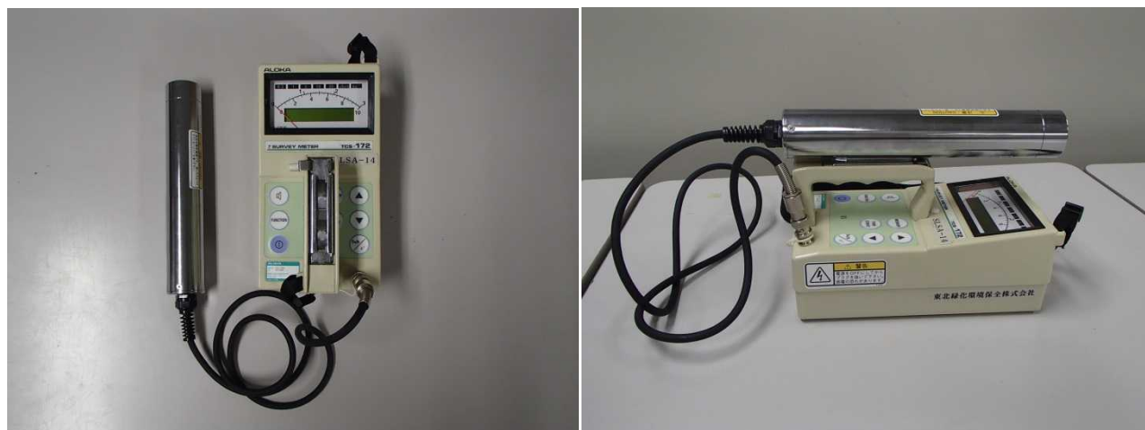
図 5 サーベイメータ