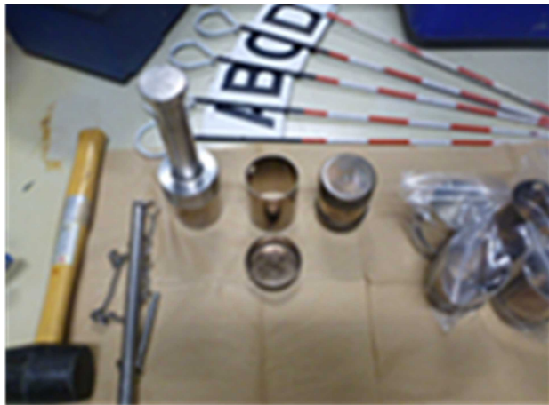
図 2 採土器等