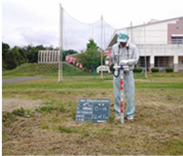
図 4 空間線量率の測定（例）

サーベイメータの検出部を水平に保持し、地表上 1m の高さで測定した。時定数は、30 秒 ( 0.1 \mu\text{Sv/h} 以上の場合は 10 秒) に設定し、時定数の 5 倍の時間を保持後、指示値を時定数の間隔で 5 回読み取った。平均値に校正定数を乗じて、空間線量率を求めた。