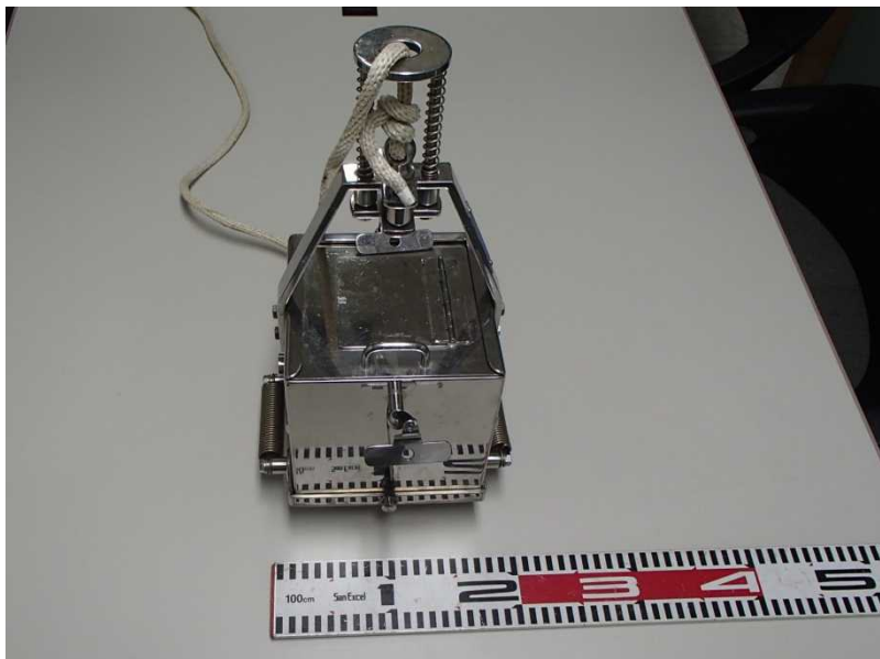
図1 エクマンバージ型採泥器