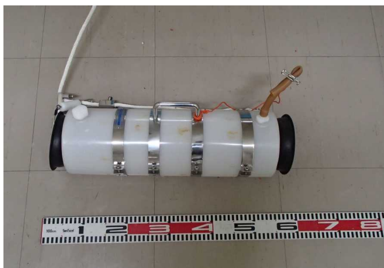
図 6 バンドーン型採水器