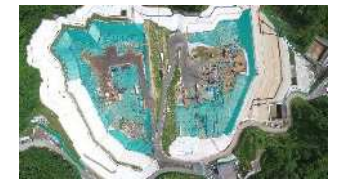
特定廃棄物埋立処分場