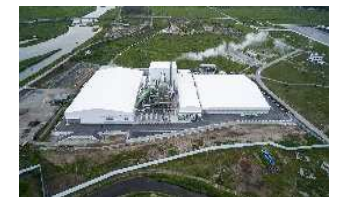
浪江町 仮設焼却施設