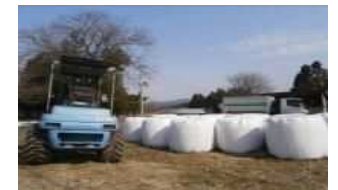
農林業系廃棄物(稲わら、牧草等)

お問合せ先： 環境省 環境再生・資源循環局 特定廃棄物対策担当参事官室 電話：03-6457-9098