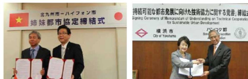
都市間のハイレベルでの署名 (地方公共団体のノウハウ・知見の共有)