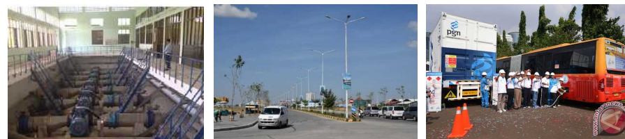
ソリューションとして具体的JCMプロジェクトを形成 (都市間連携から生まれたJCMプロジェクト約20件)

お問合せ先： 環境省 地球環境局 地球温暖化対策課 市場メカニズム室 電話：03-5521-8246