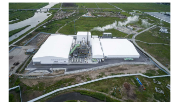
浪江町 仮設焼却施設