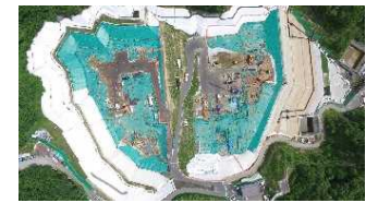
特定廃棄物埋立処分場