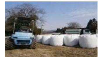
農林業系廃棄物(稲わら、牧草等)