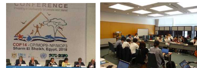
過去に開催された会議の様子

お問合せ先： 環境省自然環境局自然環境計画課生物多様性戦略推進室・生物多様性主流化室 電話：03-5521-8275