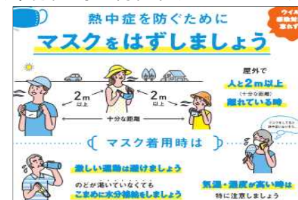
図: 「新しい生活様式」における熱中症対策のイメージ (環境省・厚生労働省リーフレットより)

お問合せ先: 環境省大臣官房環境保健部 環境安全課 電話: 03-5521-8261