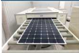
<太陽光発電設備リサイクル設備>