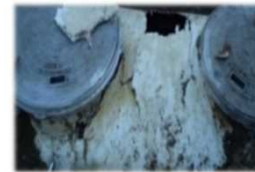
老朽化している単独処理浄化槽