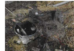
風水害による破損のリスク