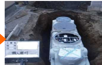
合併処理浄化槽設置