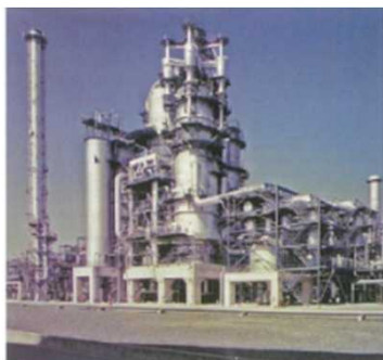
<石油精製所を活用したリサイクル設備>