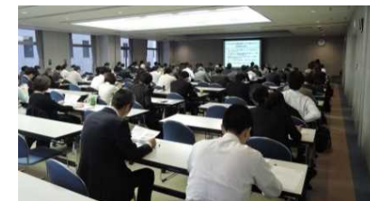
アジア水環境改善ビジネスセミナー (H28.4.21 於東京、約94名(60社)が参加)