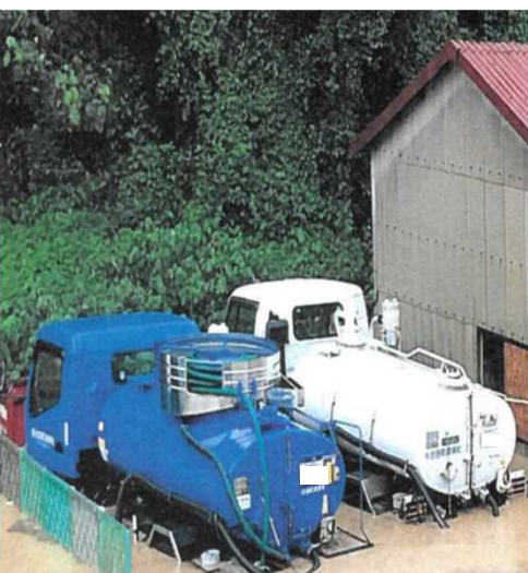
① 仮設トイレのし尿収集・運搬及び処分