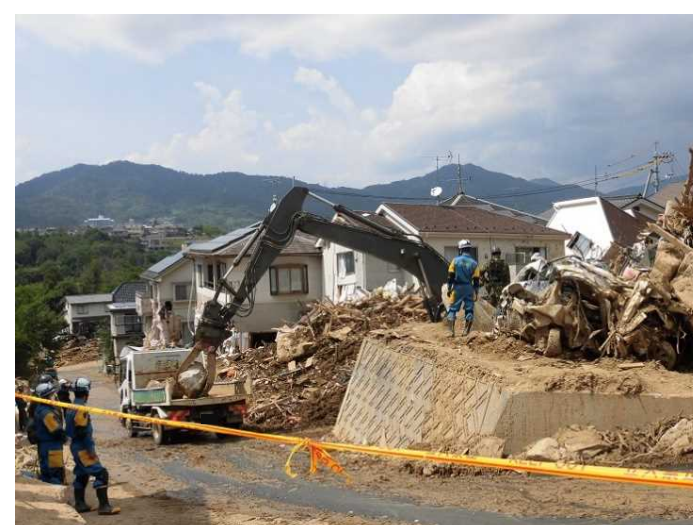
③ 損壊した家屋等の解体、がれきの収集・運搬及び処分