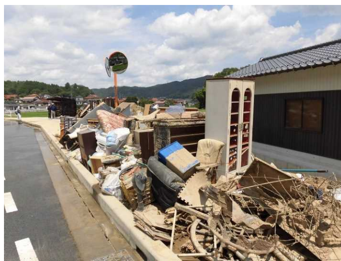
② 片付けごみの収集・運搬及び処分