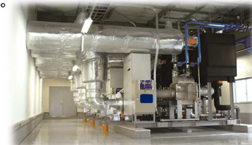
<冷凍冷蔵倉庫への導入イメージ>