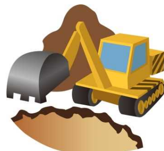
一時埋設イノシシ等の処理