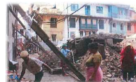
地震による建物の崩壊(地震)

災害時に一度に大量に発生する災害廃棄物を適正に処理できない状況となっており、生活環境や公衆衛生の悪化だけでなく、資源効率の観点からも改善すべき状況