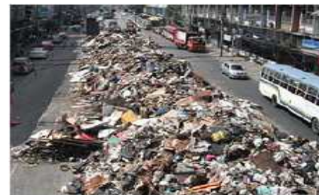
路上に放置された災害廃棄物(水害)