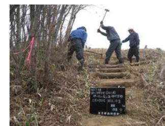
登山道の維持・補修