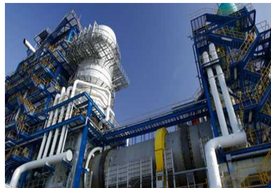
(参考イメージ) 我が国の高度な技術を有する日本企業のサーマルリサイクル発電設備を備えた焼却炉