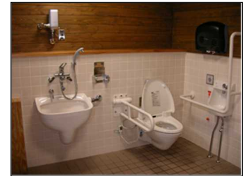
【ユニバーサルデザイン】