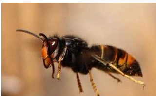
ツマアカスズメバチ