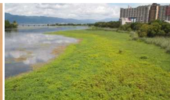
オオバナミズキンバイ