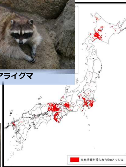
全国に分布が拡大 (まん延期)