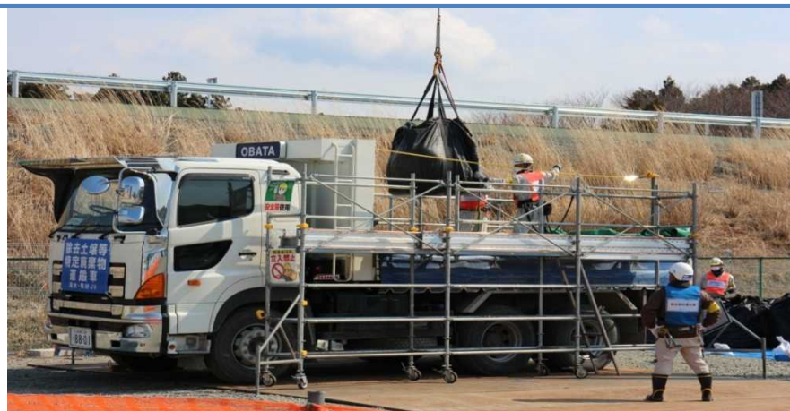
仮置場からの搬出作業

引き続き地元の御理解を得ながら、中間貯蔵施設の整備等を着実に実施することで、除染を迅速に進め、事故由来放射性物質による環境の汚染が人の健康又は生活環境に及ぼす影響を速やかに低減し、復興に資する。