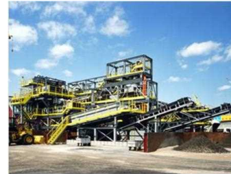
土壌分級プラントの例 (※)分級とは、セシウムが細粒分に付着しやすい特性を踏まえ、除去土壌をふるい等にかき、粒度別(シルト、年度、砂、レキ)に分離する技術