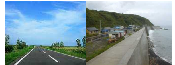
再生利用の例 (左：道路の路盤材、右：防潮堤の芯部)