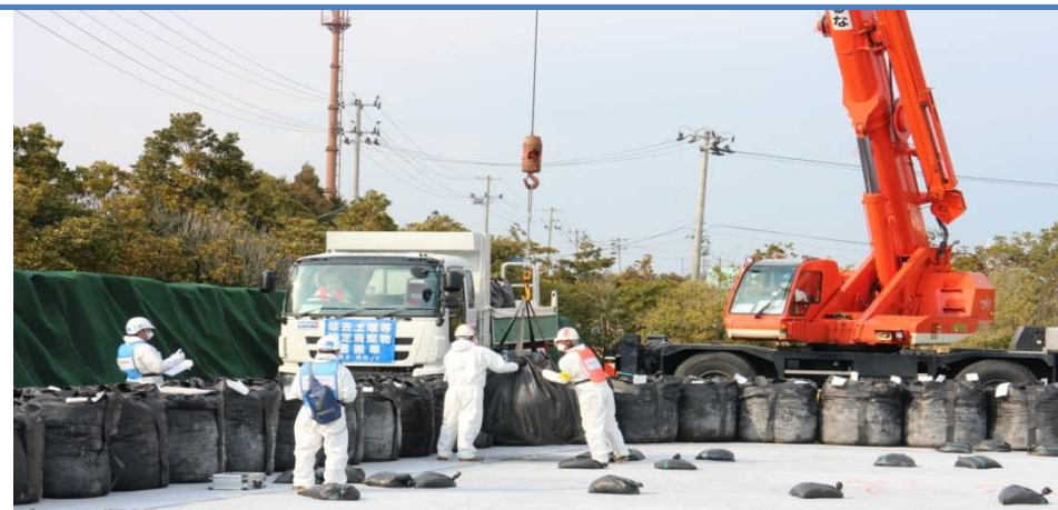
保管場への搬入・定置作業