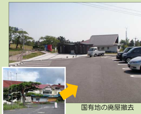
国有地の廃屋撤去

観光客が集まる地域にふさわしくするため、老朽化施設の再整備や国有地内における廃墟の撤去など景観再生を実施