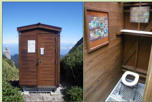
山岳地等における生態系保全

多くの利用者が訪れる地区及びフィールドにおいて、利用者による自然生態系への影響を軽減し、質の高い利用施設の整備を実施