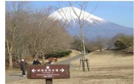
長距離自然歩道(東海自然歩道)