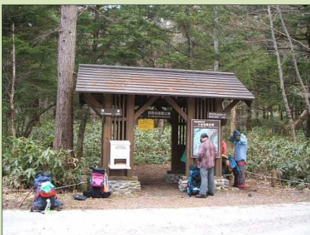
適正かつ質の高い利用を促進