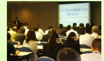
アジア水環境改善ビジネスセミナー (H26.5.13 於東京、約120名が参加)