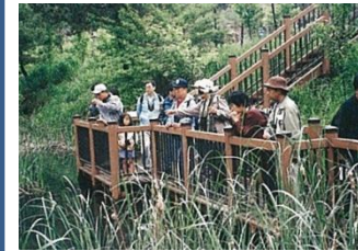
利用施設(遊歩道)の整備