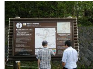
多言語対応の情報提供施設の整備