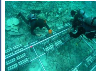
自然資源(サンゴ)の再生・維持