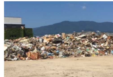
災害廃棄物の大量発生