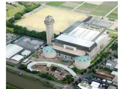
地域の災害対応拠点となり得る廃棄物処理施設の整備を支援