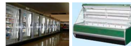
<冷凍冷蔵ショーケース>

お問合せ先: 環境省 地球環境局 地球温暖化対策課 フロン対策室 電話: 03-5521-8329