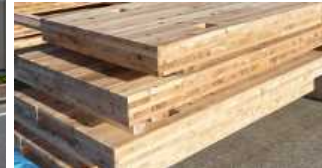
③ZEH (-M) に対する低炭素素材・再エネ熱利用技術の導入への支援

<参考：低炭素素材> CLT：直交集成板（Cross Laminated Timber）