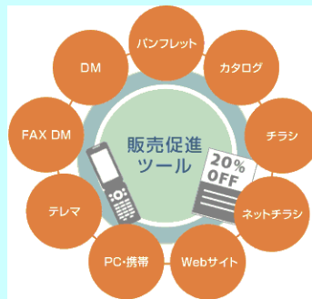
事業者の販売促進活動

なお、5つ星家電等対象製品の販売増の目標を設定するとともに、実施した販売促進策の内容や販売促進を講じた際の販売数の比較等について報告することを条件とする。