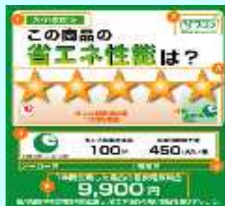
統一省エネルギーラベル