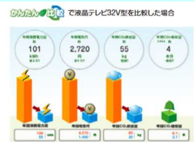
省エネ製品買換えナビゲーションシステムのデータ活用