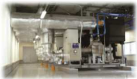
<中央方式冷凍冷蔵機器>