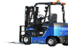
燃料電池 フォークリフト