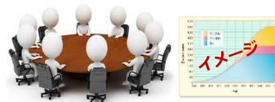
浮体式洋上風力発電の早期普及に向けた検討