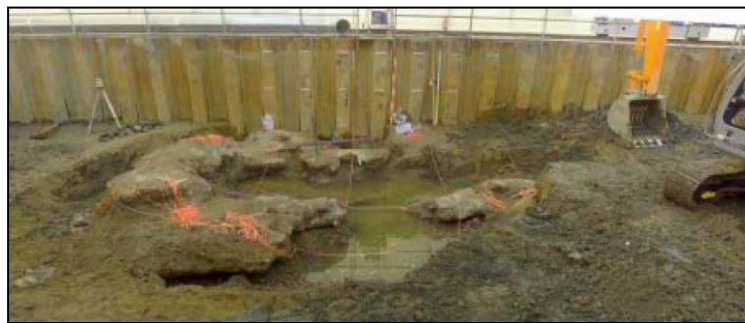
汚染源掘削調査により発見されたコンクリート様の塊（平成 17 年 1 月 27 日）