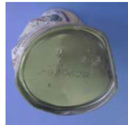
コンクリート様の塊中から発見された飲料用缶（製造年月日 1993（平成 5）年 6 月 28 日）