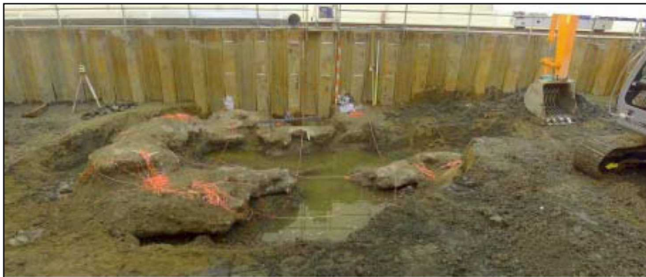
汚染源掘削調査により発見されたコンクリート様の塊（平成 17 年 1 月 27 日）