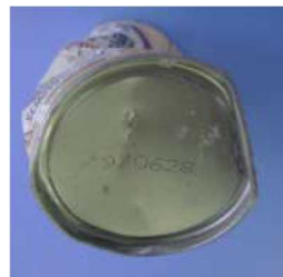
コンクリート様の塊中から発見された飲料用缶 （製造年月日 1993（平成 5）年 6 月 28 日）