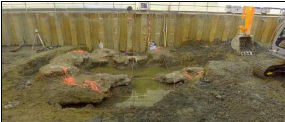
汚染源掘削調査により発見されたコンクリート様の塊（平成 17 年 1 月 27 日）