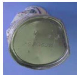
コンクリート様の塊中から発見された飲料用缶 （製造年月日 1993（平成 5）年 6 月 28 日）