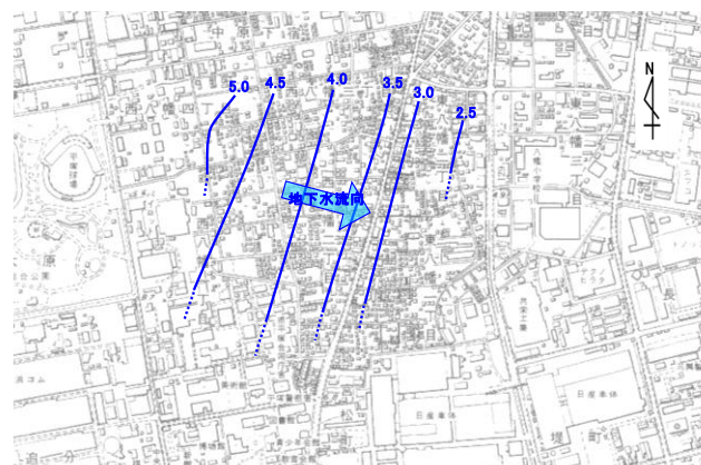
図 1-2 地下水の流れと地下水位の等高線 秋季：平成 23 年 2 月測定 (地下水位等高線の単位：標高m)