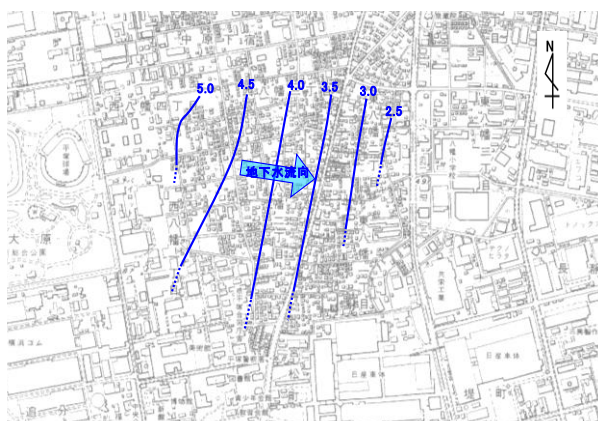
図 1-1 地下水の流れと地下水位の等高線 秋季：平成 22 年 11 月測定 (地下水位等高線の単位：標高m)